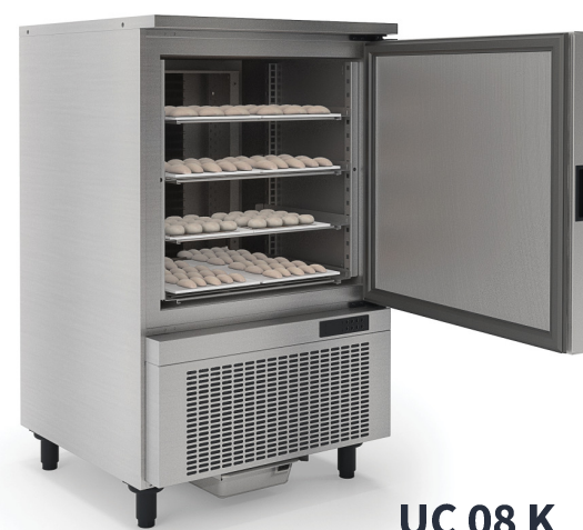
UC 08 K