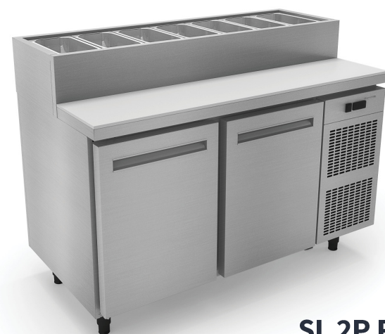
SL 2P R